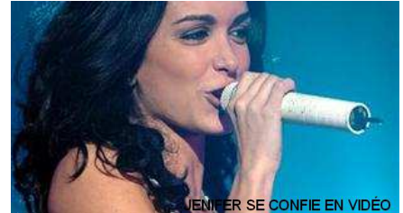
JEFFER SE CONFIE EN VIDÉO