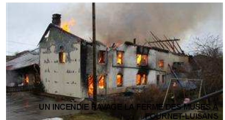
UN INCENDIE RAVAGE LA FERME DES MUSES A JOURNET-LUISANS