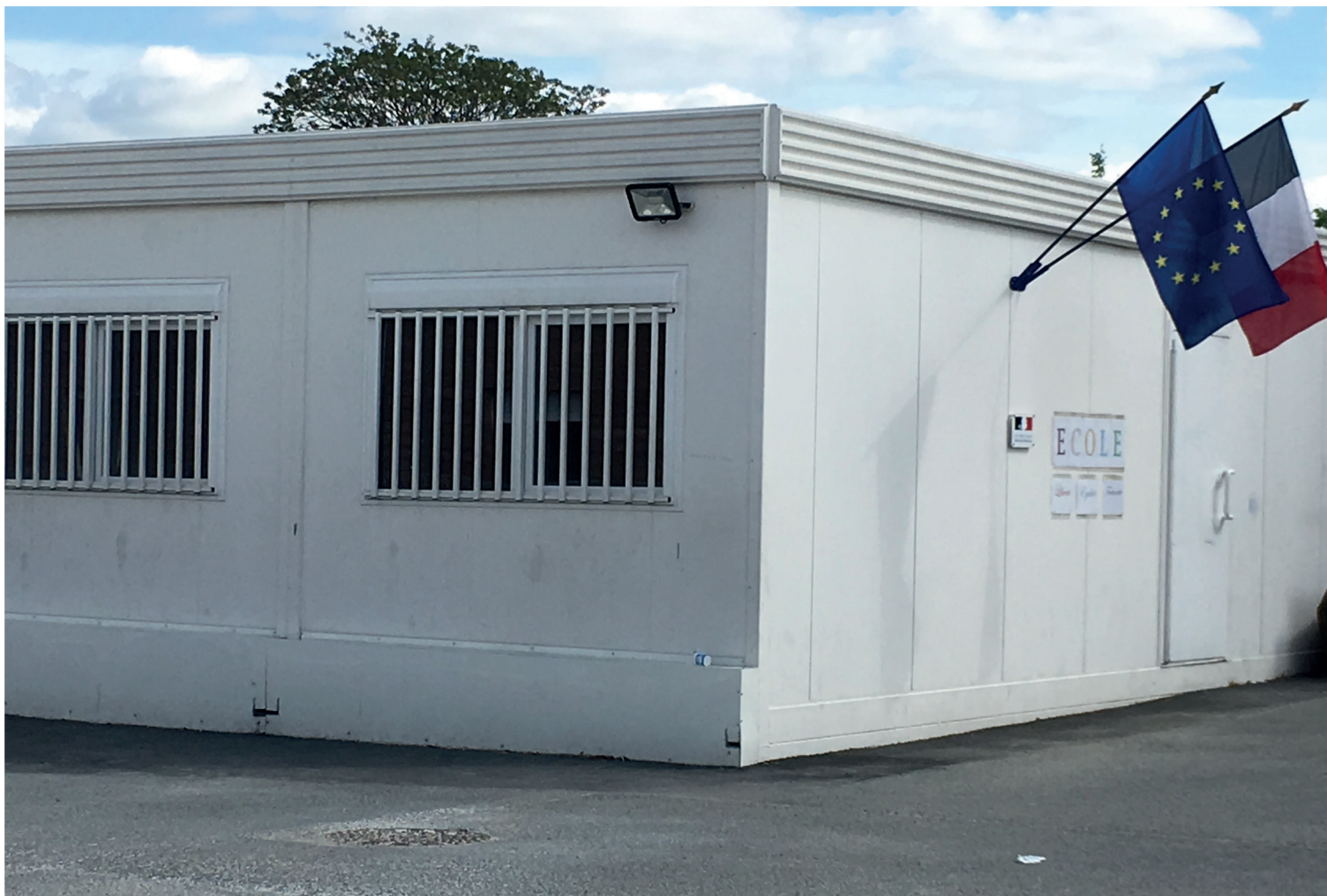
Centre des Migrants Emmaüs : l'école