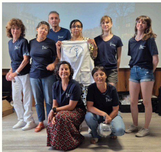
FGOH Formateurs 2025

En 2024, l'association a dû ajuster sa stratégie de recrutement des bénévoles en raison de l'afflux massif de candidatures qui dépassait largement le nombre de missions disponibles. Traditionnellement, les bénévoles pouvaient postuler via le site internet lorsqu'une mission était publiée ou envoyer des candidatures spontanées directement aux coordinatrices salariées, ou être recrutés lors des formations humanitaires en gynécologie-obstétrique (FGOH). Cependant, pour mieux gérer cette surabondance de candidats, GSF a choisi de restreindre les candidatures en ligne en ouvrant celles-ci uniquement en cas de mission confirmée avec un examen attentif des dossiers de recrutement et, le cas échéant, de réorienter vers notre activité SOLISAFE-CAMIFRANCE ou vers les ONG partenaires, offrant ainsi d'autres opportunités aux candidats. Cette approche permet de maintenir un équilibre entre l'offre de missions et la qualité du recrutement tout en soutenant d'autres organisations dans le besoin.